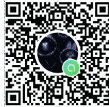
大会LINEオープンチャット QRコード