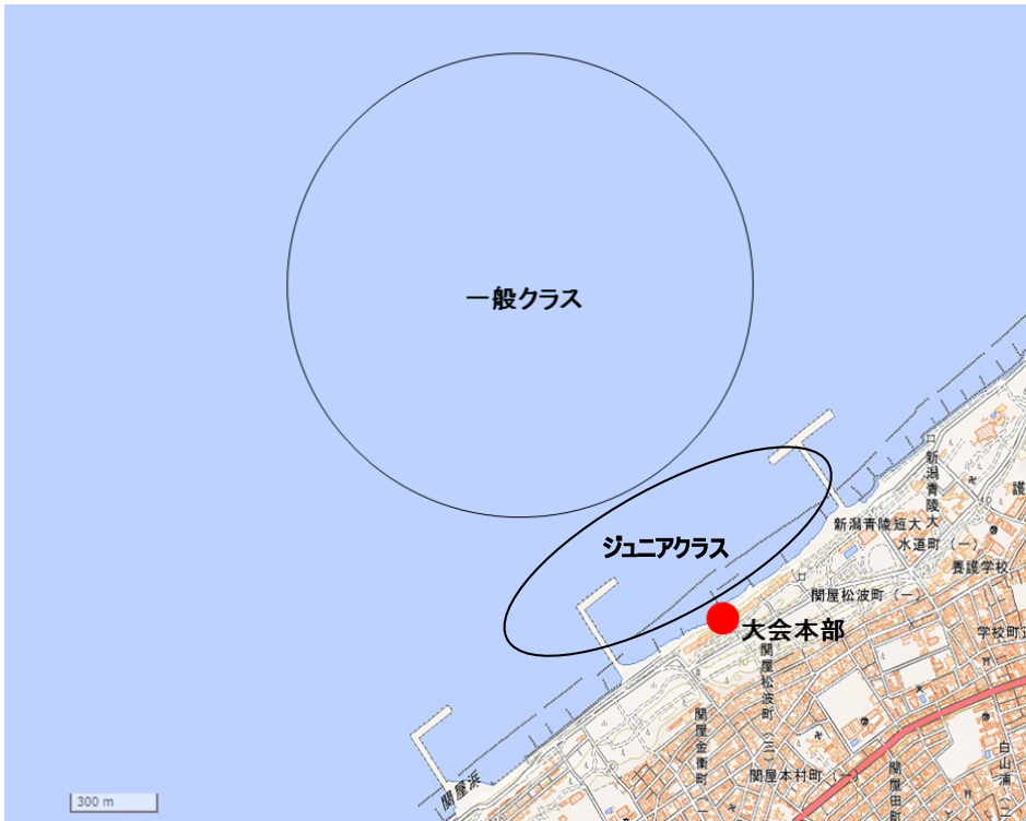
添付図B コース見取り図